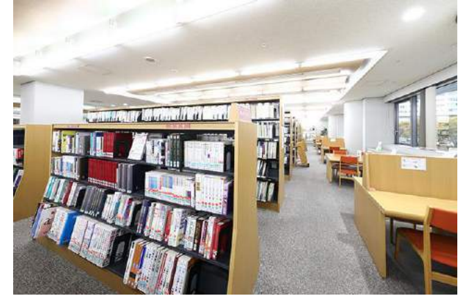
ドーンセンター 情報ライブラリ

<共同指定管理者> 株式会社カクタス / 一般財団法人大阪府男女共同参画推進財団