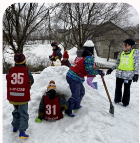
積雪不足でスキー体験が難しい場合は、別のプログラムに変更し実施いたします。